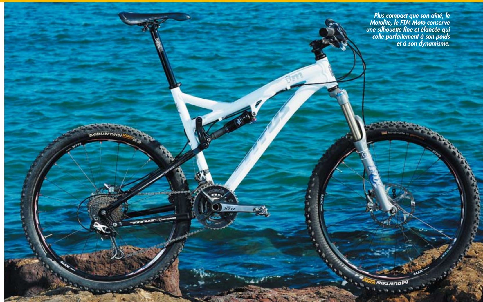
Plus compact que son aîné, le Motolite, le FTM Moto conserve une silhouette fine et élancée qui colle parfaitement à son poids et à son dynamisme.

Performante donc sous les coups de jarret en limitant quasi totalement le phénomène de pompage (le ProPedal du Fox RP23 aide bien), la suspension arrière motrice fort. Dans les côtes les plus sévères, il ne faut pas hésiter à jouer du réglage de débattement de la fourche Fox Talas pour limiter les cabrages. En tout cas, dans ce registre de la grimpe, le FTM Moto égale