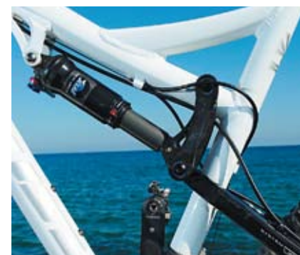
La suspension arrière ne fait pas dans le tape-à-l'œil, mais fonctionne parfaitement bien !