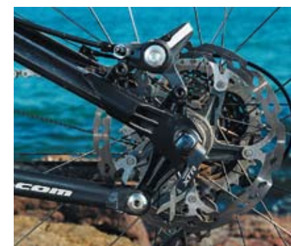
Les pattes arrière, dans lesquelles s'engouffrent les haubans en carbone nervurés, sont de toute beauté. Notez la qualité de la visserie.

largement des VTT en 120 mm de débattement. En revanche, dès que ça dévale, il fait preuve d'une aisance et d'un comportement ludique séduisant. ProPedal désactivé sur l'amort, débattement maximal sur la fourche, et tous freins lâchés, il profite d'une rigueur de châssis et d'une homogénéité de suspension qui lui permettent de dégringoler à tombeau ouvert. Précis et vif dans son positionnement, il se joue des sentiers les plus sinueux et techniques, malgré un boîtier de