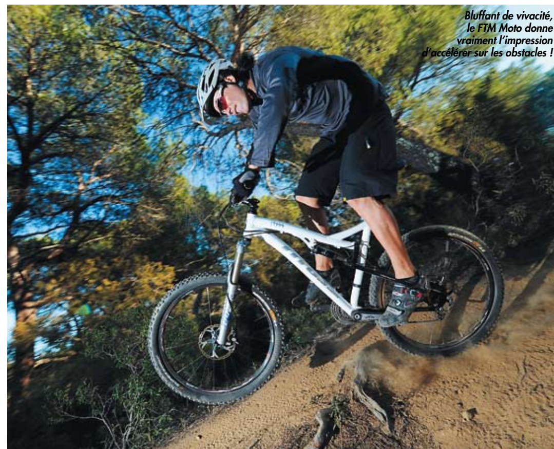
Bluffant de vivacité, le FTM Moto donne vraiment l'impression d'accélérer sur les obstacles !

Successeur du mythique et performant Titus Motolite, le FTM Moto en conserve l'âme mais rafraîchit un bon coup sa ligne. C'est du moins ce que Titus promet. Voyons voir ça sur le terrain !